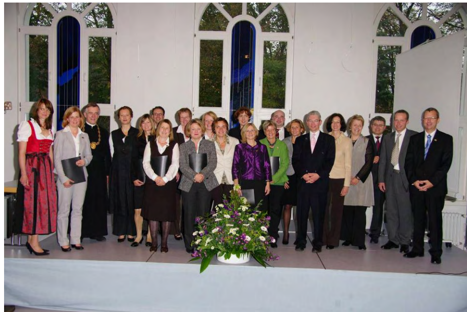
Foto vom Fakultätsfest im Oktober 2008 mit dem auch das neue Promotionsprogramm offiziell gestartet wurde.

Im August 2008 wurde die Promotionsordnung der Pflegewissenschaftlichen Fakultät zur Erlangung des akademischen Grades einer Doktorin oder eines Doktors der Pflegewissenschaft (Dr. rer. cur.) durch das Ministerium für Bildung, Wissenschaft, Jugend und Kultur des Landes Rheinland-Pfalz genehmigt. Sie wurde am 25.8. 2008 im Staatsanzeiger für Rheinland-Pfalz veröffentlicht. Die Pflegewissenschaftliche Fakultät hat daraufhin im Oktober mit einem Festakt offiziell das neue Promotionsprogramm gestartet. Rund 200 Gäste aus Politik, Wissenschaft, Kirche, Wirtschaft und Praxis nahmen an der Feierlichkeit teil. Im Rahmen des Festakts wurden auch zwei neue Professorinnen der Fakultät ernannt und 17 Absolventinnen und Absolventen des Masterstudiengangs Pflegewissenschaft verabschiedet.