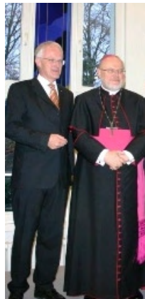
(Foto: Ehrendoktor Erzbischof Dr. Reinhard Marx (re.) mit dem Laudator Dr. Jürgen Rüttgers, Ministerpräsident von NRW)

Am 22. Januar 2009 hat die Theologische Fakultät in einem Festakt, an dem mehrere hundert Gäste teilnahmen, dem Münchener Erzbischof, Dr. Reinhard Marx, die Ehrendoktorwürde verliehen. In seiner Laudatio charakterisierte der Ministerpräsident von Nordrhein-Westfalen, Dr. Jürgen Rüttgers, Marx als einen Mann des Wortes und der Tat, des Maßes und der Mitte, ein Theologe der Praxis. Als ehemaliger Bischof von Trier hatte er entscheidend dazu beigetragen, dass die einstige Ordenshochschule um die Pflegewissenschaftliche Fakultät erweitert werden konnte.